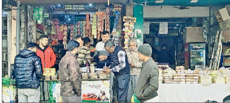
भिवानी। पॉलिथिन रखने वालों का चालान काटते हुए।