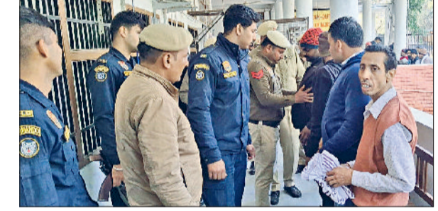
चरखीदादरी। अदालत परिसर में सर्व अभियान चलाते पुलिसकर्मी

चरखी दादरी। गणतंत्र दिवस पर सुरक्षा के महानजर चरखी दादरी पुलिस और स्पेशल कमांडो टीम ने मंगलवार जिला न्यायालय परिसर में सर्व ऑपरेशन चलाकर सुरक्षा व्यवस्था को सुदृढ़ किया। ऑपरेशन के तहत पुलिस टीम ने न्यायालय के अंदरूनी व बाहरी क्षेत्रों, पार्किंग स्थल और प्रतीक्षालयों का निरीक्षण कर सखिध पदार्थों और अवैध वस्तुओं की तलाशी के लिए जांच की। पुलिस अधीक्षक चरखी दादरी ने कहा कि गणतंत्र दिवस पर किसी भी संभावित अपराध को रोकने व सुरक्षा को देखते हुए सर्व ऑपरेशन चलाया गया है। समय-समय पर ऐसे सर्व ऑपरेशन चलाकर पुलिस प्रशासन किसी भी तरह की आपत्तिका स्थिति से पहले ही निपटने का प्रयास करता है। उन्होंने आमजन से अपील करते हुए कहा कि किसी भी अज्ञात वस्तु को बिना जानकारी स्पष्ट नहीं करे।