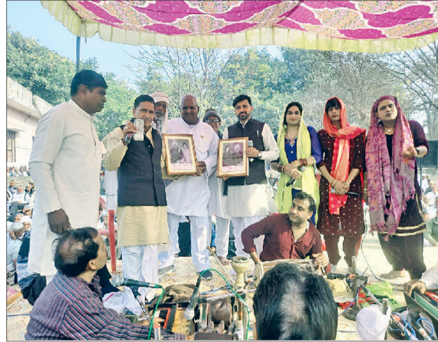
भिवानी। बापोड़ा में सांग का मंचन शुरू करवाते हुए।

ऐतिहासिक प्रसंगों के बीच कलाकारों ने अपनी प्रस्तुति से उपस्थित जनसमूह को भाव-विभोर कर दिया। मंचन की शुरुआत राजा उत्तानपाद के महल के दृश्यों के साथ हुई। कलाकारों ने दिखाया कि किस प्रकार अवधपुरी के राजा उत्तानपाद की बड़ी रानी सुनीति संतान न होने के कारण गहरे शोक में डूबी रहती थीं। कहानी में मोड़ तब आया जब देवीप नारद का महल में आगमन हुआ। रानी की व्यथा सुनकर नारद मुनि ने उन्हें समाधान स्वरूप राजा का दूसरा