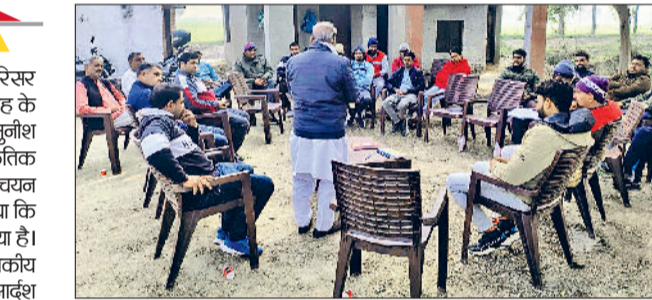
भिवानी। मांगों को लेकर आयोजित बैठक में आंदोलन की रणनीति तय करते हुए।