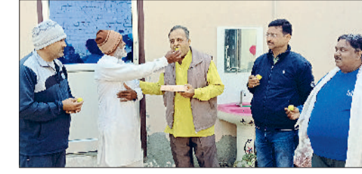
भिवानी। नितिन नबीन के राष्ट्रीय अध्यक्ष बनने पर एक दूसरे को मिठाई खिलाकर बधाई देते भाजपाई।