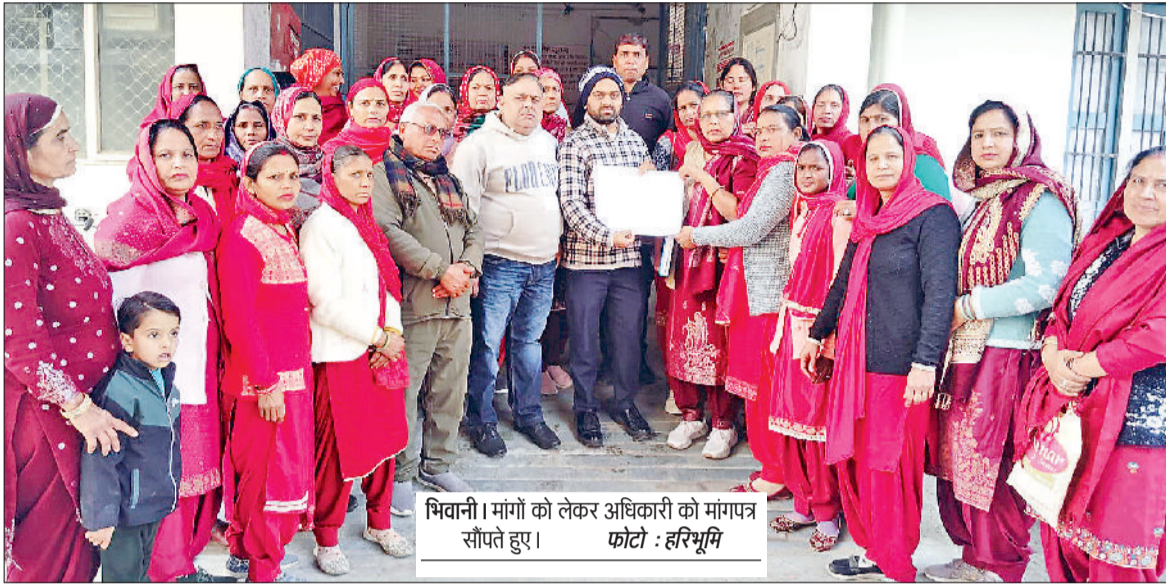
भिवानी। मांगों को लेकर अधिकारी को मांगपत्र सौंपते हुए।